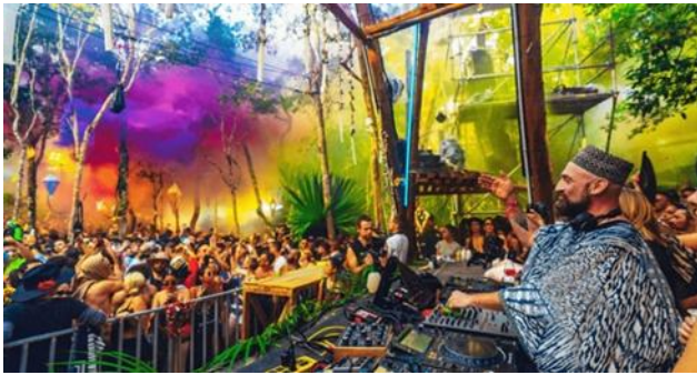
Figura 2. Representativa de Day Zero 2025.

El sistema sonoro es diseñado para acompañar la experiencia sensorial a lo largo de la noche, con equipos de alta potencia distribuidos de manera secuencial, con el objetivo de proporcionar una experiencia auditiva completa a la vez que se minimiza el impacto sobre el medio ambiente. La mezcla de la iluminación y proyecciones laser con las copas de los árboles y la superficie del cenote, genera paisajes visuales, que, en fotografías, adquieren un carácter casi surrealista. (Day Zero, 2026)