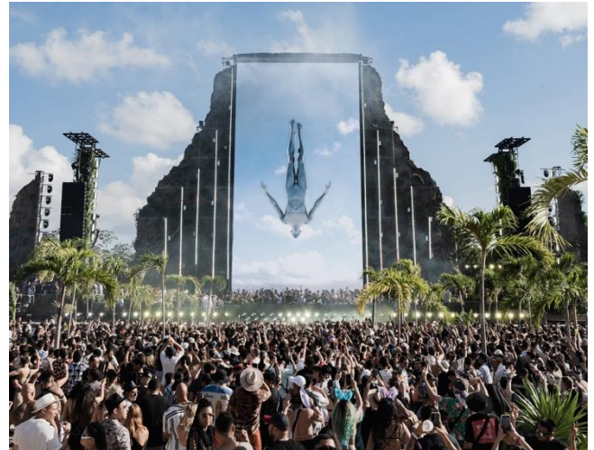
Figura 1. Representativa de Afterlife Zamna Tulum. (2025).

ofrecieron también paquetes que cubrían varios días del festival. Los precios de los tickets oscilan entre 100 y 4000 USD, mientras que los pases de acceso VIP cuestan aproximadamente 500 USD. (Home Zamna Festival, 2026)