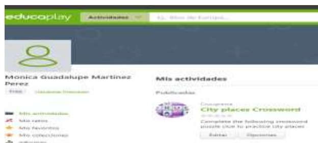
Figura 7. Educaplay City places Crossword

Wikis. Acaban con la jerarquización y la unidireccionalidad del aprendizaje y extienden el espacio y el tiempo de formación a cualquier lugar con conexión