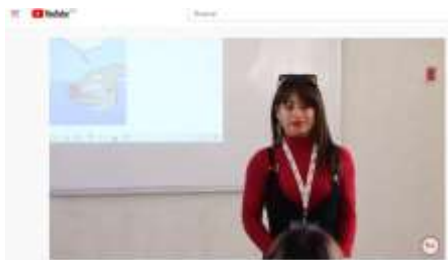
Figura 5 Grabación video de una clase en YouTube

Blogs. A nivel docente se suele utilizar para compartir ideas, contenidos didácticos, comentarios de los estudiantes o como instrumento de comunicación en el aula, para el anuncio de eventos, sesiones de tutorías, publicar trabajos, recibir comentarios, etc.