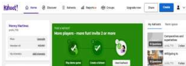
Figura 6. Kahoot comparatives and superlatives

Creación de material didáctico en línea Kahoot, Educaplay. Nos permiten diseñar material dinámico, atractivo y novedoso en línea, encaminado a las necesidades y nivel de cada grupo, captando la atención y entretenimiento del estudiante, fomenta la competitividad positiva entre ellos.