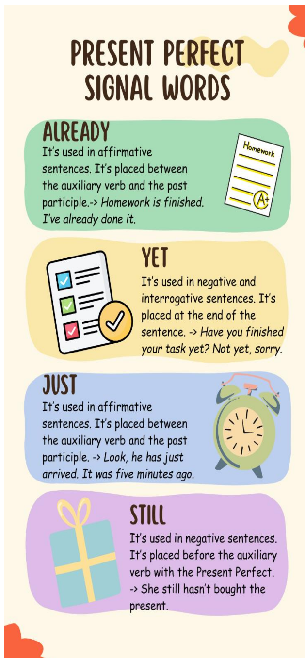
Figure 1. Signal words