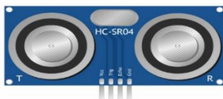
Figura 2 Sensor HC-SR04. (Intesc, 2017)

El sensor ultrasónico como su nombre lo indica mide la distancia mediante el uso de ondas ultrasónicas, El cabezal emite una onda ultrasónica y recibe la onda reflejada que retorna desde el objeto. Los sensores ultrasónicos miden la distancia al objeto contando el tiempo entre la emisión y la recepción (Corona, Abarca & Mares, 2019).