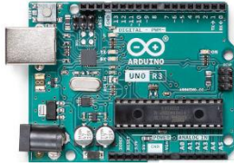
Figura 1 Arduino uno (Arduino, 2021)

proyectos por uno mismo en lugar de contratar profesionales y es por eso que para esta práctica se eligieron el sensor ultrasónico y el buzzer como base para posteriormente realizar proyectos más ambiciosos.