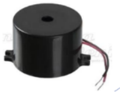
Figura 3 Buzzer. (Arduino,2021)

Por cierto, cuanto mayor sea la frecuencia de la onda Sonora, se hace más agudo el sonido resultante y al revés.