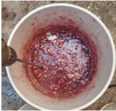
Figura 6. Proceso de mezclado sometidos a agitación mecánica.