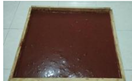
Figura 13. Lámina biopolimérica obtenida en molde plano, equivalente a un área aproximada de 3600 cm 2 de lámina de 3 mm de espesor.

Rendimiento: De 1 kg de paxtle fresco se pueden obtener aproximadamente 100 g de fibra/polvo seco, equivalentes a aproximadamente 3600 cm 2 de lámina de 3 mm de espesor (Figura 13).