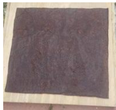
Figura 9. Muestra de lámina bio polimérica final.

El resultado del proceso fue una lámina bio polimérica (Figura 9) denominada piel vegetal elaborada a partir de recursos naturales (paxtle o heno motita), con potencial aplicación en la confección de accesorios u otros productos sostenibles (Figura 10).