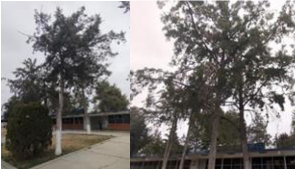
Figura 1. Árboles dañados por el Heno Molita.

fotosintética, lo cual debilita a los árboles hospedadores generando un “parasitismo estructural” y provocando