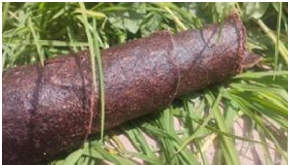
Figura 11. Lámina bio polimérica obtenida con tonalidad más clara y textura lisa.

Se obtuvieron diferentes muestras de láminas tipo piel vegetal: De un pulverizado fino se obtiene una lámina más homogénea y lisa (Figura 11), mientras que de un pulverizado grueso se obtiene una lámina rugosa con textura fibrosa (Figura 12).