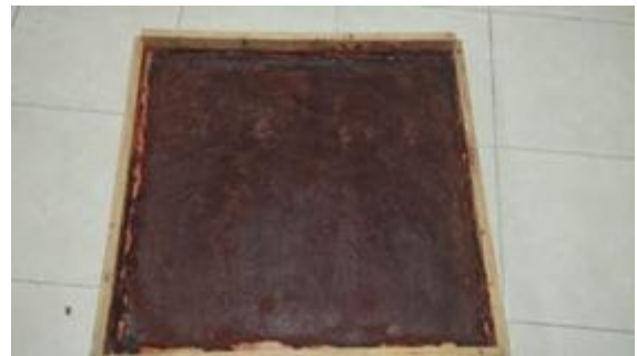
Figura 8. Mezcla semi seca distribuida en molde plano previo al proceso de secado final.

Las láminas se dejaron secar en un ambiente ventilado durante 3 a 5 días, moviéndolas periódicamente para asegurar una deshidratación uniforme en ambas caras. Al alcanzar un contenido de humedad equilibrado, se obtuvo un material flexible y resistente, con propiedades mecánicas comparables a las de una piel natural (Figura 8).