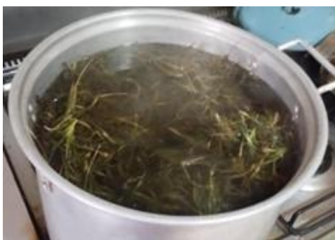
Figura 3. Procedimiento de escaldado en agua hirviendo.

La materia prima vegetal, proveniente de Tillandsia recurvata (paxtle), también conocido como heno motita, se recolectó en estado fresco de árboles infestados y de materia caída de los mismos, para después seleccionar manualmente la materia prima procurando minimizar la presencia de impurezas (ramas, piñas, plumas, insectos, etc). Posteriormente, se realizó un prelavado con agua corriente y un escaldado para inactivar enzimas y limpiar la fibra (University of Georgia, 2025) mediante inmersión en agua en ebullición (94 °C) durante 10 min (Figura 3). Este tratamiento térmico, seguido de un enfriamiento rápido en agua fría, tuvo como objetivo eliminar contaminantes microbianos y detener procesos enzimáticos que pudieran afectar la calidad del material.