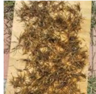
Figura 4. Proceso de secado de materia prima (Paxtle).

algunas muestras se trituró en un molino de discos y para otras muestras un procesador multifuncional hasta obtener un polvo fino y homogéneo en ambos casos (Figura 5). La reducción de tamaño de partícula es importante debido a que influye directamente en la textura, densidad y propiedades mecánicas del biomaterial obtenido.