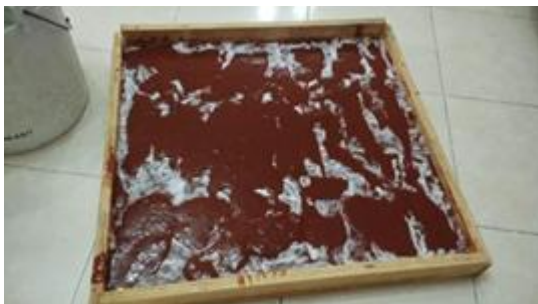
Figura 7. Vertido de la mezcla final en moldes planos.

La mezcla final se vertió en bandejas planas, distribuyendo de manera uniforme para obtener láminas de espesor constante (Figura 7). En algunos casos, se incorporaron capas intermedias de algodón como soporte adicional.