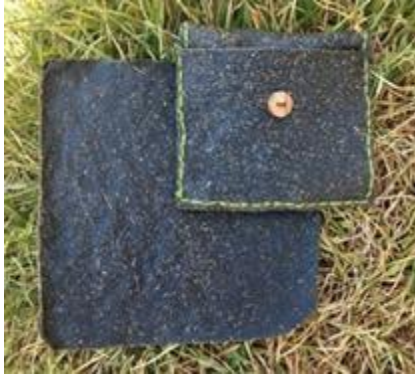
Figura 10. Accesorio elaborado a partir de lámina bio polimérica tipo piel vegetal.

Nota: Las condiciones climáticas influyen en el tiempo de secado según la cantidad de mezcla y el tamaño del molde.