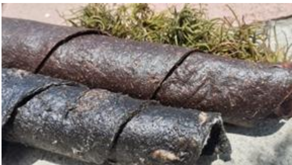
Figura 12. Lámina bio polimérica con tonalidad más oscura y textura rugosa.

De un molde grande con la mezcla distribuida se obtienen láminas delgadas y flexibles, mientras que de un molde pequeño con la mezcla concentrada se obtienen láminas más gruesas y resistentes.