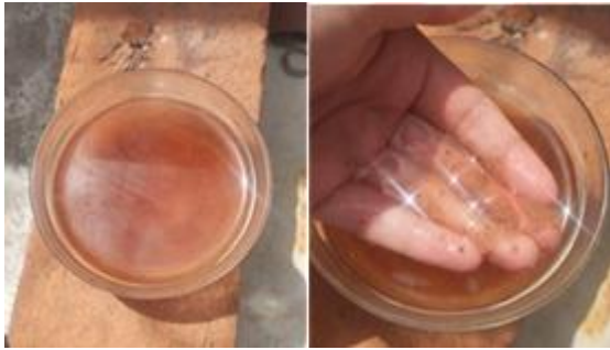
Figura 15. Disolución completa del fragmento de 5 cm 2 en agua tras 72 horas de inmersión.

Las propiedades y características del biomaterial desarrollado en comparación a otro tipo de materiales se encuentran reflejados en la tabla 2.