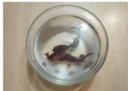
Figura 14. Inicio del proceso de disolución de un fragmento de 5cm 2 como evaluación de su comportamiento en el medio acuoso.

En pruebas de degradabilidad, basadas en los principios de degradación en medios acuosos (ISO, 2019), un fragmento de 5 cm 2 se disolvió en 100 ml de agua en un lapso de 72 horas, resultando en una solución aprovechable para riego (Figuras 14 y 15).