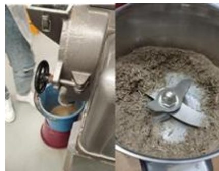
Figura 5. Molienda de paxtle utilizando un molino de discos.