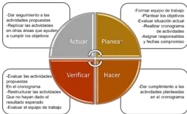
Figura 1. Ciclo PHVA.

La Figura 1 muestra un esquema del ciclo PHVA, donde se resume lo antes mencionado.