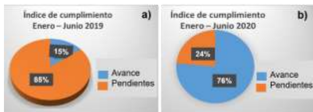
Figura 4. Comparativo de cumplimiento en entrega de vehículos a los usuarios; a) enero-junio 2019 y b) enero-junio 2020.

Con ayuda del ciclo PHVA, el diagrama causa efecto y el diagrama de Pareto se determinó que el principal factor que afecta en el retraso de entrega de servicios es que no existe una adecuada programación de mantenimientos preventivos. Ante esto, la empresa puso a prueba un plan de mantenimiento preventivo tomando en cuenta, la disponibilidad de los usuarios, priorizando áreas, así como a los vehículos que presentan fallas recurrentes. Con la metodología básica empleada en el programa de mantenimiento preventivo se logró aumentar la eficiencia en un 61% como se muestra en la Figura 4.