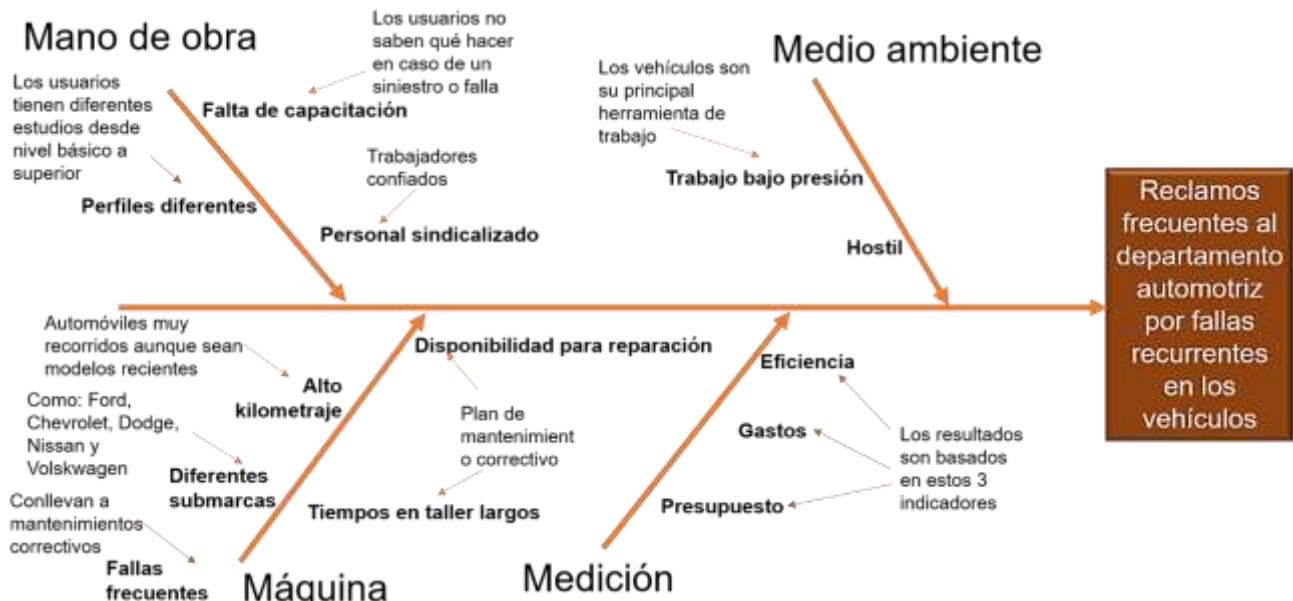
Figura 2. Diagrama causa-efecto de factores que intervienen en la problemática.