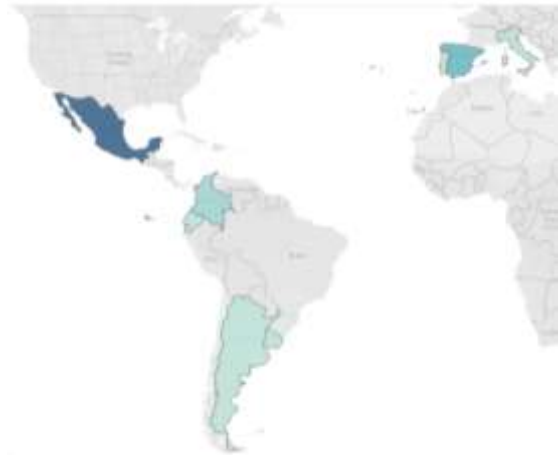
Figura 1. Países donde se han llevado a cabo los estudios.

Durante la revisión se observó que de los documentos revisados, los estudios se han llevado a cabo preferentemente en países latinoamericanos, como se observa en la figura 1.