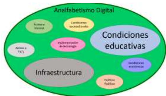
Fig. 2 – Variables que abordan el analfabetismo digital

La identificación de las variables comunes se hizo a través de la técnica de observación, es decir, se leyeron los documentos en estudio y se llenó una tabla que permitió identificar las variables en estudio de cada documento. De esta manera, las variables con más frecuencia de aparición en cuanto al tema de analfabetismo digital fueron condiciones educativas e infraestructura, que son la que en el gráfico se muestran más grandes. Figura 2: