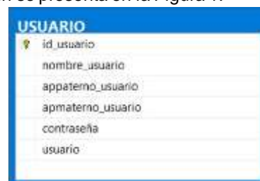
Figura 1. Tabla con datos vulnerables

Una de las tablas consideradas para aplicar el proceso de encriptación se presenta en la Figura 1.