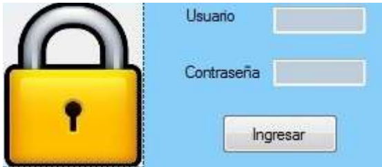
Figura 4. Interfaz con proceso de desencriptar

A través de la validación de cada usuario con su contraseña, que son los datos que fueron almacenados encriptados, se hace necesario el proceso de desencriptación, ya que este proceso debe ser transparente para él. La interfaz a través de la cual los usuarios realizan dicha validación se muestra en la Figura 4.