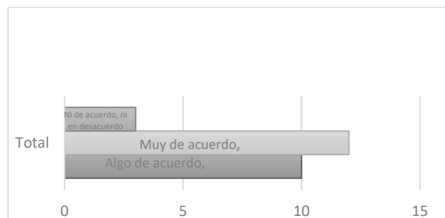
Figura 3. Respuesta del cuestionario aplicado a egresados, a la pregunta: ¿Considera que su programa educativo aportó los conocimientos y habilidades necesarios para desempeñar su profesión?

De la aplicación del mencionado instrumento se hace un análisis de los Items que se consideran relevantes para esta investigación. En el primero de ellos, se les realiza la pregunta respecto que si considera que su programa educativo aportó los conocimientos y habilidades necesarios para desempeñar su profesión