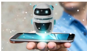
Figura 8. Cepsa incorpora la inteligencia artificial de IBM a la gestión de RRHH mediante un pionero asistente virtual. [18]

Poco a poco la raza humana ha venido conociendo y haciendo uso de diferentes dispositivos basados en la IA, a tal punto que ya no es extraño convivir con lo que se conoce como los chatbots interactivos que están en capacidad de sugerir uno u otro producto, orientarnos sobre el mejor restaurante chino, el hotel que más se adapta a nuestro presupuesto, los bienes y servicios que más nos convienen y en general situaciones, lugares, productos y servicios basándose en historial de búsquedas, o nuestras costumbres en la red, por ejemplo.