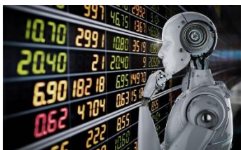
Figura 7. IA. Inteligencia artificial y finanzas. [17]

Las tecnologías y herramientas que brinda la IA a la humanidad y específicamente al área de las finanzas y las entidades bancarias en general pueden aportar a detectar fraudes, predecir patrones del mercado y aconsejar transacciones y operaciones a los clientes o potenciales clientes, entre otras.