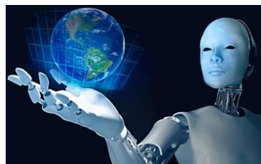
Figura 1. La naturaleza se beneficia de la Inteligencia Artificial [15]

La IA ha venido permeando diferentes ámbitos de la humanidad, y la naturaleza no ha sido ajena a esta influencia, siendo así se presentan algunas aplicaciones en las cuales, por ejemplo, vehículos submarinos no tripulados están en capacidad de detectar fugas en oleoductos, edificios inteligentes que han sido diseñados para reducir el consumo energético y conjuntos de drones que están en la capacidad de plantar millones de árboles al año para combatir la deforestación, entre otras.