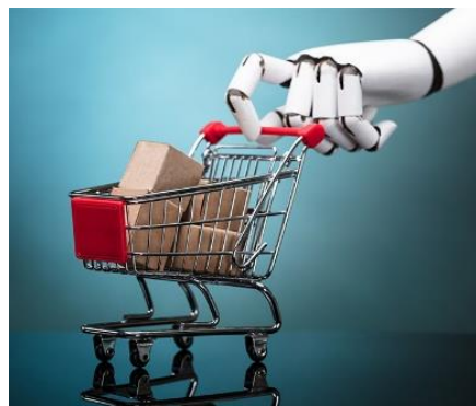
Figura 6. Inteligencia artificial para el comercio electrónico. [16]

Al hacer uso de las herramientas que ofrece y facilita la IA en el mundo de los negocios y el comercio es importante establecer que su uso busca permitir la realización de pronósticos de ventas, elegir el producto adecuado para recomendárselo al cliente. tomar las mejores decisiones en cuanto el manejo del mercado, y optimizar el uso de los recursos al interior de las organizaciones, entre otros. Es tan así que empresas como Amazon, por ejemplo, hacen uso de robots para identificar si un libro tendrá éxito o no, esto antes de su lanzamiento.