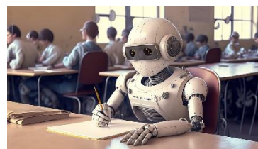
Figura 3. Inteligencia artificial en la educación: ¿cómo impacta en las aulas de clase? [11]