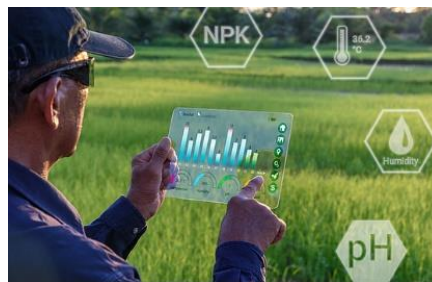
Figura 5. Inteligencia artificial en la agricultura. [13]

En el campo educativo es amplio el espectro de uso y posible uso de las diferentes IAs que existen y están por crearse, siempre se buscará el apoyo en el desarrollo de tareas académicas e incluso investigativas, es ahí donde la IA puede jugar un importante papel en los procesos de construcción del conocimiento, por ejemplo, en el marco de sus proyectos, la UNESCO sostiene que el despliegue de las tecnologías de la IA en la educación debe tener como objetivo la mejora de las capacidades humanas y la protección de los derechos humanos con miras a una colaboración eficaz entre humanos y máquinas en la vida, el aprendizaje y el trabajo, así como en favor del desarrollo sostenible [10] , además la IA esta en la capacidad de apoyar procesos administrativos ligados a los mismos procesos académicos, por ejemplo poder sugerir a un estudiante tomar un curso u otro, plantear cursos o, por qué no, crear ofertas personalizadas con el fin de optimizar el proceso de aprendizaje, entre otras..