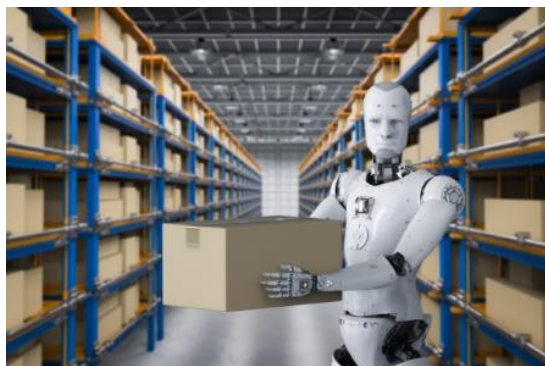
Figura 4. Inteligencia artificial logística: de dónde viene y hacia dónde nos lleva [12]

En varios lugares del mundo ya se hace uso de lo que se conoce como los semáforos inteligentes y en general dispositivos que hacen uso de la IA y permiten mejorar y aportar en la organización del tráfico en las ciudades, entre otras tareas que son y pueden ser apoyadas haciendo uso de la IA y sus aplicaciones en tal sentido. Por otro lado, en cuanto a medios de transporte varios de ellos hacen uso tanto de aplicaciones como de máquinas que gozan de cierto grado de autonomía y que buscan apoyar procesos tanto de logística como de transporte en pro de mejorar la calidad de vida de los seres humanos ya que permiten desarrollar este tipo de actividades de una manera ágil, oportuna y con una reducción sustancial del tiempo de respuesta ante determinado requerimiento. Se busca, entre otras, evitar colisiones, trancones y optimizar el tráfico. Entre otras.