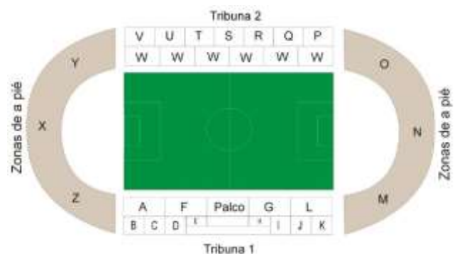
Figura 1. Esquema del Heysel Stadium para la final Juventus vs Liverpool 1985. 18

Para 2013 la imagen de los aficionados ingleses y la seguridad social que rodea los estadios era diferente a la de la década de 1980, los estadios lucen tranquilos y ordenados, los arrestos fuera y dentro de inmuebles deportivos son bajos, la imagen de Inglaterra a nivel internacional ya no es relacionada con violencia, y la Premier League es la liga más lucrativa a nivel mundial con ganancias registradas en 3.1 billones de libras (4.9 billones de dólares). Aunque no todo ha sido perfección. De igual forma, han existido críticas al modelo de seguridad, ya que el aficionado promedio batalla bastante para conseguir el dinero de las entradas y al ser las clases bajas y medias-bajas las más apasionadas a sus equipos los estadios no son tan cálidos para el equipo local como solían serlo años atrás. El dilema ahora está entre la pasión, la afición y la seguridad. 8,20