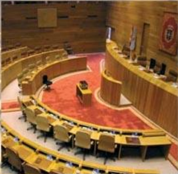
Instituciones autonómicas y administración pública

Es la parte de los órganos del estado que dependen directamente o indirectamente del poder ejecutivo, tiene a su cargo la actividad estatal que no desarrollan los demás poderes su acción es continua y permanente siempre persigue el interés publico, adopta una organización jerarquizada.