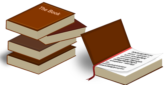
Figura 3: Conclusión