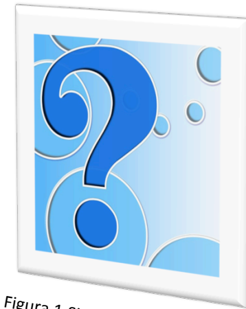
Figura 1: Signo de interrogación

¿Qué tipos de evaluación existen de acuerdo a su finalidad o función?