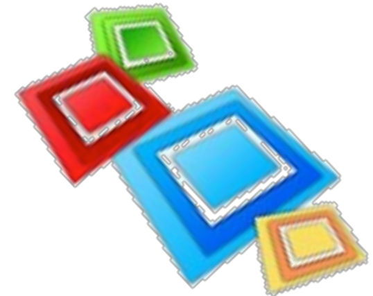
Figura 2: Índice