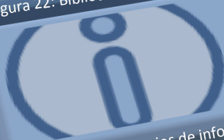
Figura 22: Bibliotecas digitales