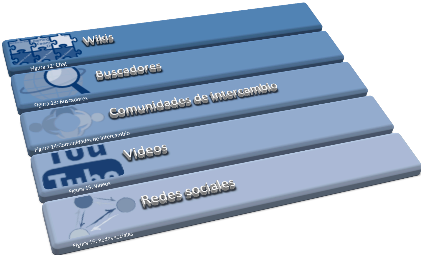
Figura 12: Chat