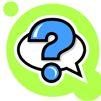
Figura 1: Signo de interrogación

¿Cuáles son los servicios disponibles en Internet y su aplicación en la educación?