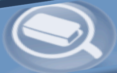
Figura 21: E-Learning