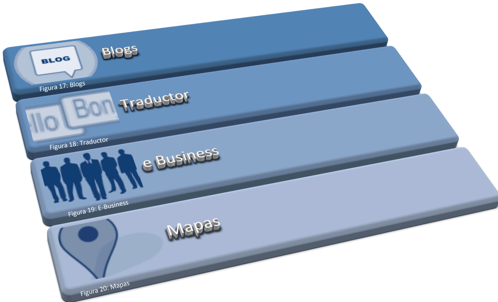
Figura 17: Blogs