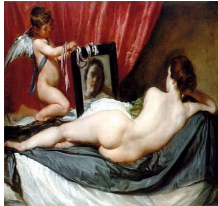
LA VENUS EN EL ESPEJO