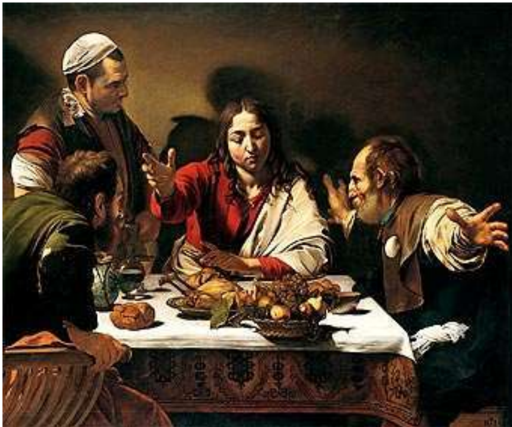
La cena de Emaus