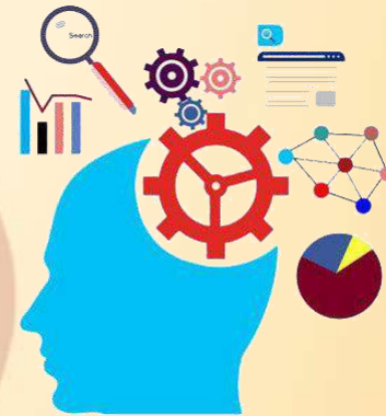
Imagen recuperada de:

La educación sin lugar a duda, es uno de los procesos más importantes que puede vivenciar el ser humano, por los aprendizajes a nivel social, curricular, disciplinar e individual que allí suelen construirse.