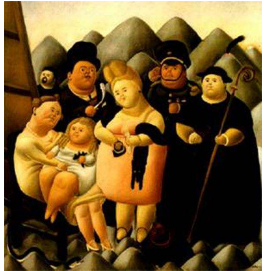
“La familia del presidente”, Fernando Botero

Evoca reflexión, disfrute, contradicción, diversión, risa.